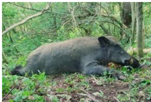
Lage des Reviers: